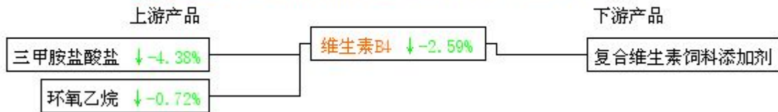
生意社维生素B4产业链价格涨跌图 2014-02-21 - 2014-03-21