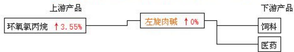
生意社左旋肉碱产业链价格涨跌图 2014-02-21 - 2014-03-21