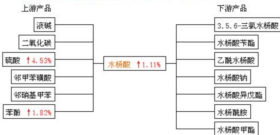
生意社水杨酸产业链价格涨跌图 2014-02-21 - 2014-03-21