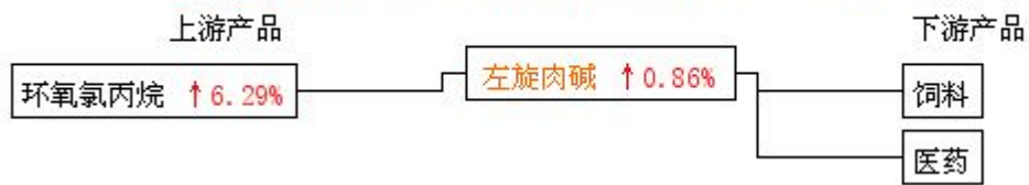
生意社左旋肉碱产业链价格涨跌图 2014-02-28 - 2014-03-28