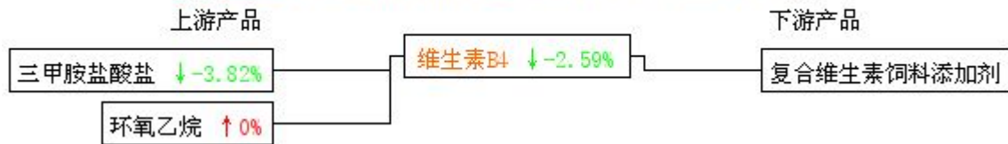
生意社维生素B4产业链价格涨跌图 2014-02-28 - 2014-03-28