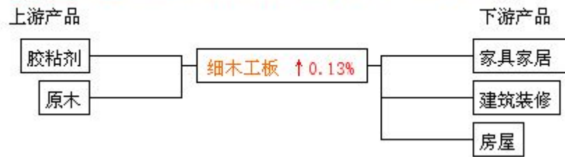
生意社细木工板产业链价格涨跌图 2014-08-26 - 2014-09-26