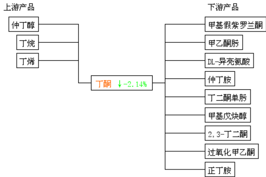
生意社丁酮产业链价格涨跌图 2015-01-13 - 2015-02-13